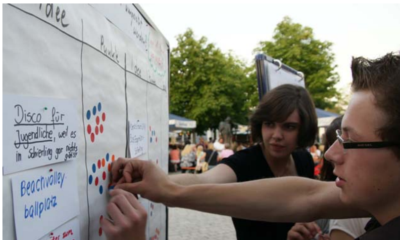
Sich entscheiden lernen!