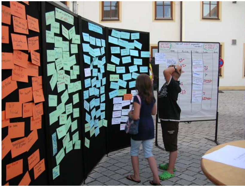
Sich informieren, was alles vorgeschlagen wurde