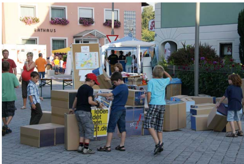
Im Spiel gemeinsam „Schierling bauen“