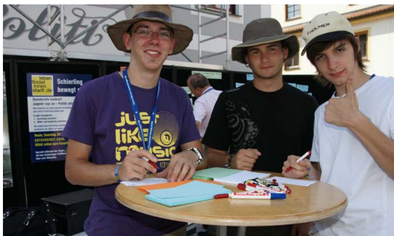
Daumen hoch für das Pilotprojekt