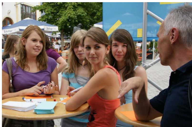
Diskussionen mit der Zukunft