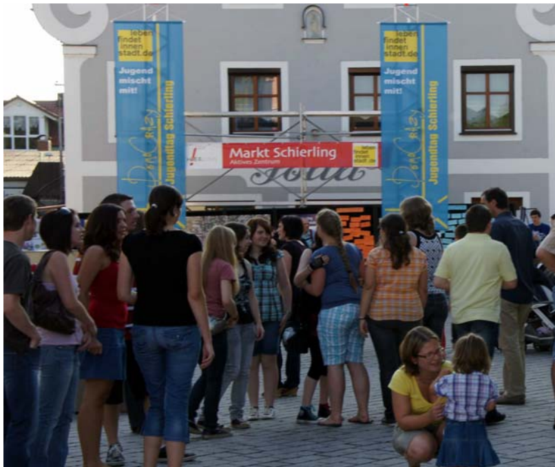
Der Auftritt des Marktes Schierling war jugendgerecht, markant und einladend