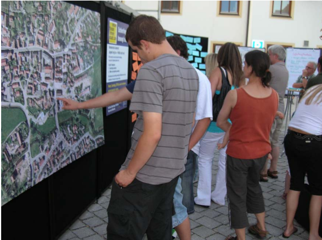
Die konkrete Arbeit am Ortsplan war ein Schwerpunkt der Kontakte zwischen jungen Menschen und Verantwortlichen des Marktes Schierling